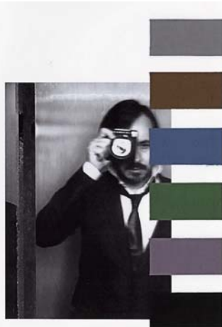
the darker tones of sepia and coloured grey will create a nostalgic climate of creation