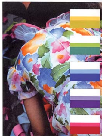
faded two-tone harmonies will flourish on white or dark grounds