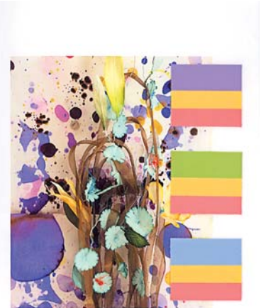
faded floral garlands demonstrate the use of a bouquet of colours