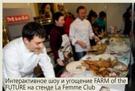
Интерактивное шоу и угощение FARM of the FUTURE на стенде La Femme Club