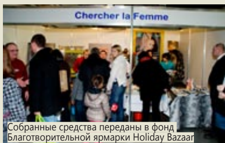
Собранные средства переданы в фонд Благотворительной ярмарки Holiday Bazaar

Второй день. На благотворительной ярмарке Holiday Bazaar участницы мастер-класса могли поработать волонтерами и опробовать на практике знания, полученные в первый день.